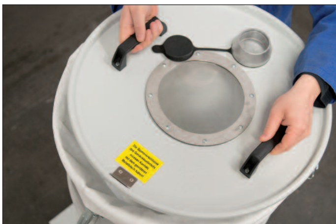
Egyszerű szűrőcsere a fedél levételével