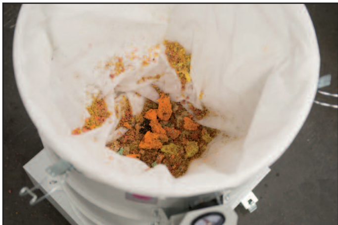
A vágási maradék összegyűjtése gyapjúzsákban

A DAV-SB sorozathoz tartozó ipari szívóberendezések alkalmazhatók termelőberendezésen keletkező szálfoszlányok, valamint vágásból származó maradványok (pl. papír, műanyag, szövet) befogadására. A szívóteljesítmény, a szerkezet és a méretek annak a termelőberendezésnek az igényeihez igazodnak, amelyen használják. Elszívja a vágási hulladékot és M porosztályú porzsákban gyűjti össze. A befogadott anyag jól összetömörödik, ezzel a szűrő térfogatát optimálisan ki lehet használni. A megtelt szűrőt könnyen ki lehet venni a szívóberendezésből.