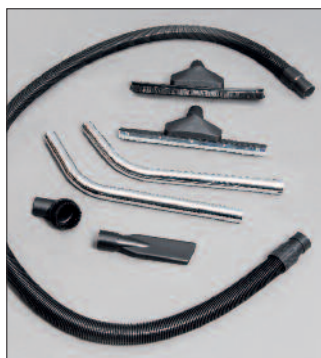
WS 100 esetén