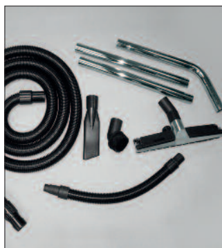
WS 200 esetén