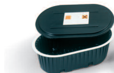
Hulladékkezelő tartály fedéllel