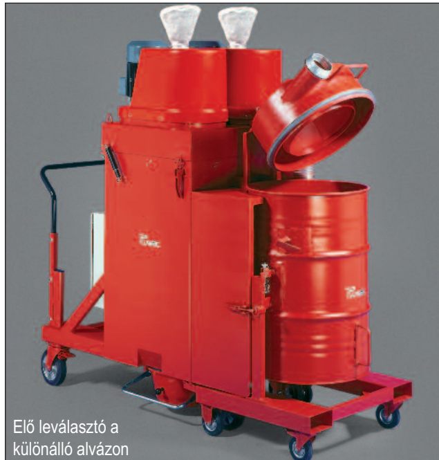
Elő leválasztó a különálló alvázon